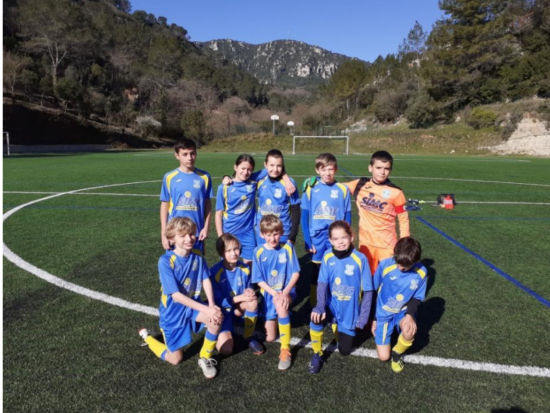
Nos U12 Pré-Excellence...