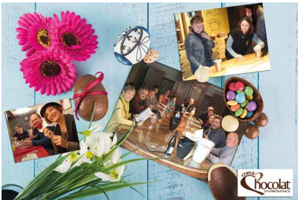
Souvenirs de notre escapade dans la Vallée du Rhône à la Cité du Chocolat Valrhona et aux cœurs des célèbres vignobles Chapoutier pour des alliances parfaites avec le chocolat ! Suivez notre actu sur Facebook !